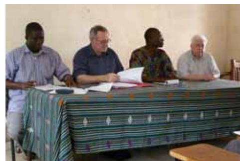
Réunion de travail à Klouékanmé

«La seule voie qui offre quelque espoir d'un avenir meilleur pour toute l'humanité est celle de la coopération et du partenariat.»