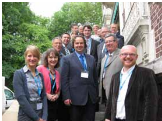
Séminaire Interreg, juin 2010

Le projet CBOOPSD aura créé l'opportunité, pour les acteurs du Pays de Saint-Omer, de développer cette plateforme multimodale d'informations dès 2011. L'impact de la dimension européenne de cette action est réel puisque, au-delà des échanges d'expériences, cela a permis le financement du projet à hauteur de 80% par des fonds européens de type FEDER.