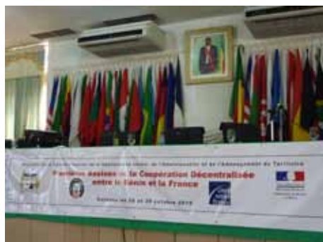
Assises de la Coopération, Cotonou - octobre 2010

Les Assises ont réuni plus de 200 personnes durant deux jours. [L'atlas de la coopération décentralisée recense 51 collectivités territoriales françaises engagées au Bénin et 70