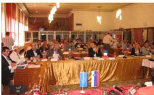
Séminaire PROSPECTS, juin 2010, Slovénie.

Le projet CBOOPSD s'avère d'ores et déjà un succès puisqu'il aura permis la mise en œuvre de plusieurs projets majeurs pour le développement du Pays de Saint-Omer , à partir d'échanges d'expériences