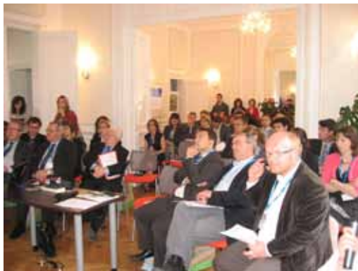
Séminaire Interreg, juin 2010

CBOOPSD s'intéresse en premier lieu aux enjeux d'accessibilité des services publics locaux. En tant qu'outil d'aide à la décision pour l'ensemble des acteurs, la mise en place d'un observatoire partagé sur cette thématique entre le Conseil Général du Pas-de-Calais et l'Agence d'Urbanisme à l'échelle du Pays de Saint-Omer permet d'identifier et d'évaluer plusieurs pistes d'actions potentielles. Le projet CBOOPSD prévoit ainsi la réalisation d'un certain nombre de projets pilotes visant à améliorer cette accessibilité .