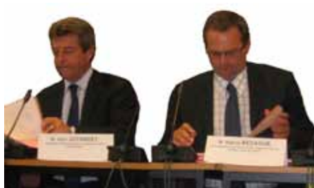
Signature de la convention entre le MAEE et la CASO - juin 2010

Ainsi, les 26 régions, plus des trois-quarts des départements, la quasi-totalité des grandes villes et des Communautés Urbaines, de très nombreuses communes moyennes ou petites et un nombre croissant de structures intercommunales sont impliquées dans des projets de coopération à l'international (Cf encadré en marge).