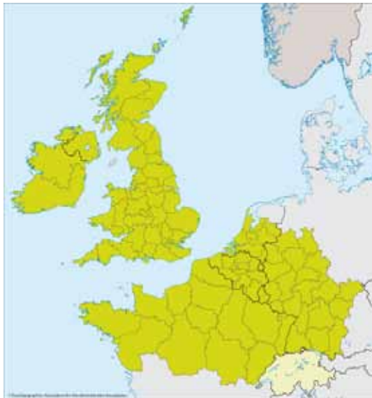
Structural Funds 2007-2013: Transnational Cooperation areas North West Europe

La coopération transnationale entre autorités nationales, régionales et locales vise à promouvoir une meilleure intégration territoriale dans l'Union grâce à la formation de grands groupes de régions européennes.