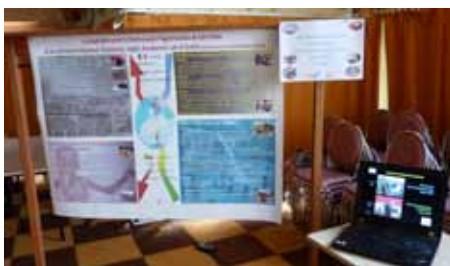
Semaine de la solidarité internationale à Arques novembre 2010