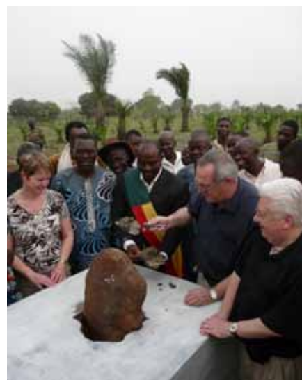
Pose de la première pierre du réseau d'adduction - mars 2010