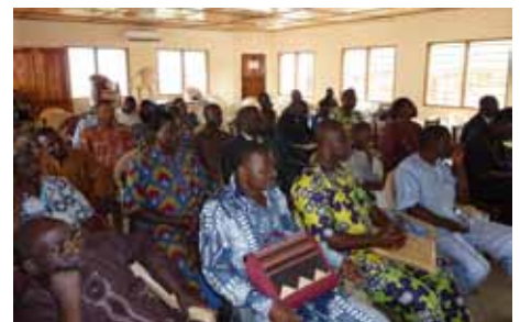
Atelier sur la planification à Aplahoué - octobre 2010