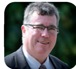
Alain MEQUIGNON Président de la Communauté de Communes du Canton de Fauquembergues