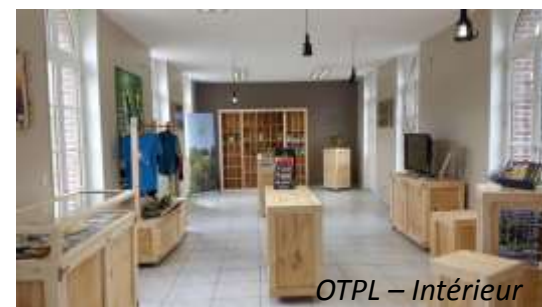
OTPL – Intérieur