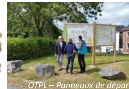
OTPL – Panneaux de départ