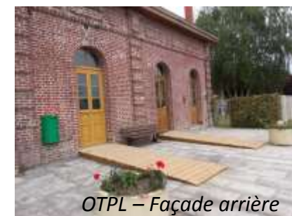
OTPL – Façade arrière